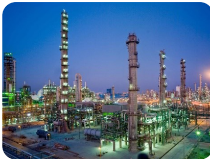
پتروشیمی بندر امام

بازسازی و تعویض کندانسور و لوله کشی چیلرها