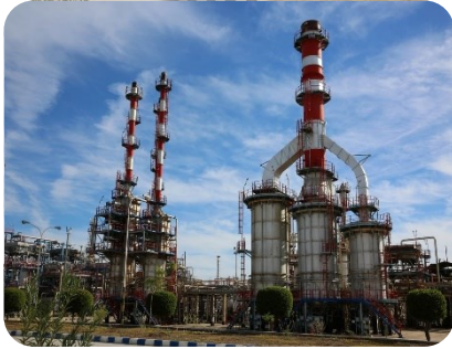
پالایش نفت لاوان

راه اندازی سیستم HVAC به همراه نصب تابلو برق