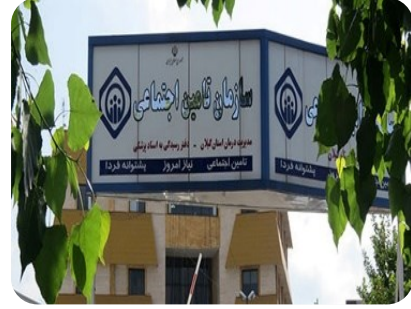
اداره تامین اجتماعی لاهیجان تامین لوله، اتصالات و شیرآلات