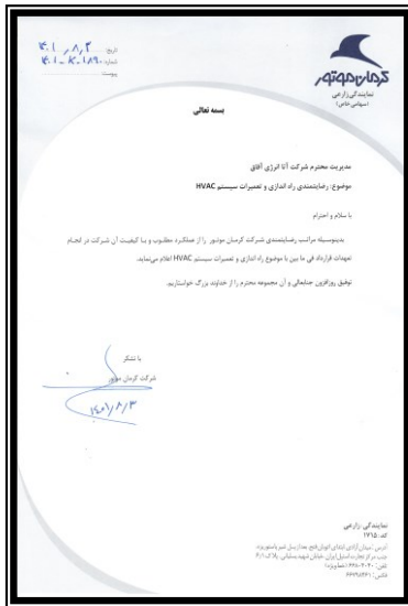
كرمان موتور (تعمیرات)