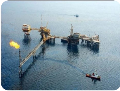
سکوی نفتی بهرگانسر