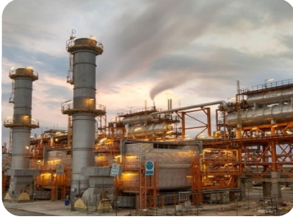
پتروپالایش کنگان تامین کمپرسور و مبدل ها