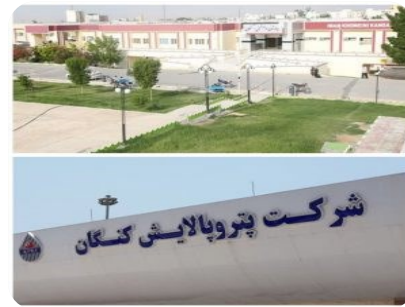
دفتر مرکزی پتروپالایش کنگان