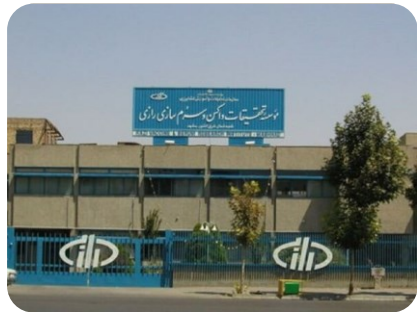
موسسه تحقیقات واکسن و سرم سازی رازی