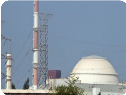
سازمان انرژی اتمی ایران تامین شیرآلات