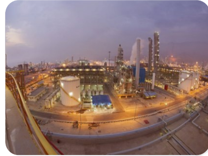
پتروشیمی لاله راه اندازی سیستم HVAC به همراه نصب تابلو برق