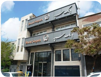
اداره زیر ساخت بانک سپه