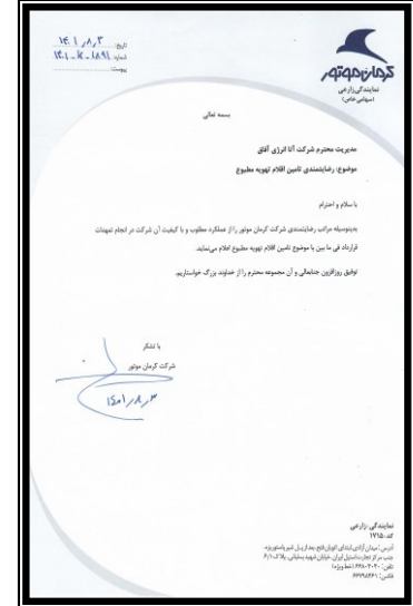
كرمان موتور (تامین)