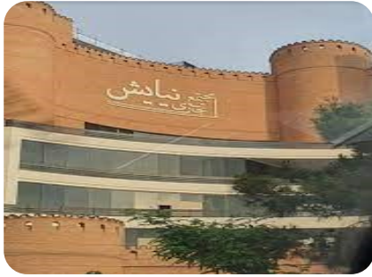
مجتمع تجاری بام نیایش