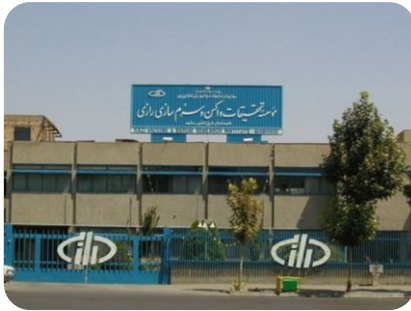
موسسه تحقیقات واکسن و سرم سازی رازی تعویض کویل حرارتی و طراحی و اجرای تابلو برقها