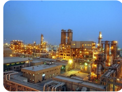
مجتمع پتروپالایش کنگان تعمیرات و راه اندازی سیستم HVAC