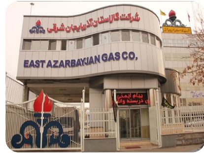
سالن اجتماعات شرکت گاز تبریز

راه اندازی سیستم HVAC به همراه نصب تابلو برق