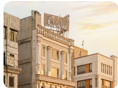
شرکت املاک آرکا ایرانیان تامین شیرآلات و اتصالات