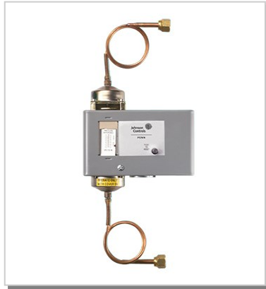
تجهیزات کنترلی (Control equipment)