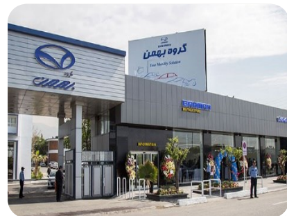
شرکت بهمن موتور