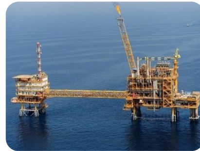
سکوی فاز ۱۲ پارس جنوبی

بازسازی و تعویض کندانسور و لوله کشی چیلرها