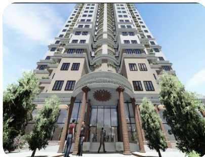
مجتمع مسکونی بامگان یاسر تعویض کویل و راه اندازی چیلر